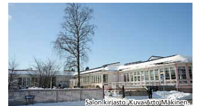
Salon kirjasto.